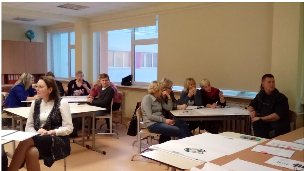
3.attēls. Diskusija par atgriezeniskās saites paņēmieniem.

Trešajā nodarbībā skolotāji uzzināja par iespēju skolēniem saņemt atbilstošu atgriezenisko saiti mācību stundā un mācību procesā mācību darba uzlabošanai, kā veidot snieguma līmeņu aprakstu un kā iesaistīt skolēnus savu sasniegumu izvērtēšanā. Pedagoģi modelēja mācību stundas, izmantojot dažādus formatīvās vērtēšanas un atgriezeniskās saites paņēmienus. Mācīšanās nav iespējama bez sadarbības, tāpēc skolotāji piedalījās lomu spēlē, mācījās sniegt atgriezenisko saiti kolēģim.