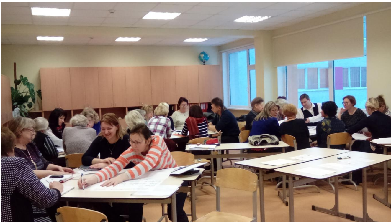
1.attēls. Grupu darbs “Kāda ir produktīva stunda?”